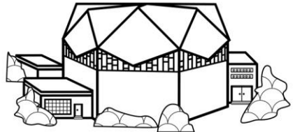
St. Franz Sales